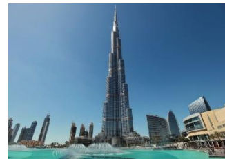
Figura 1 Burj Khalifa 1