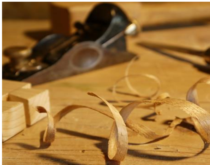
Figura 2: Attrezzi da lavoro