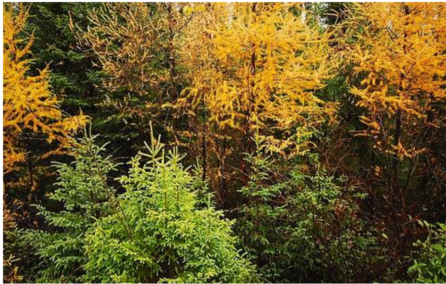
Figura 1: Bosco di conifere

Antonio Caccia è il titolare di una ditta individuale che opera nel settore della raccolta e della trasformazione del legno in prodotti per le abitazioni, gli uffici e le imprese di costruzioni.